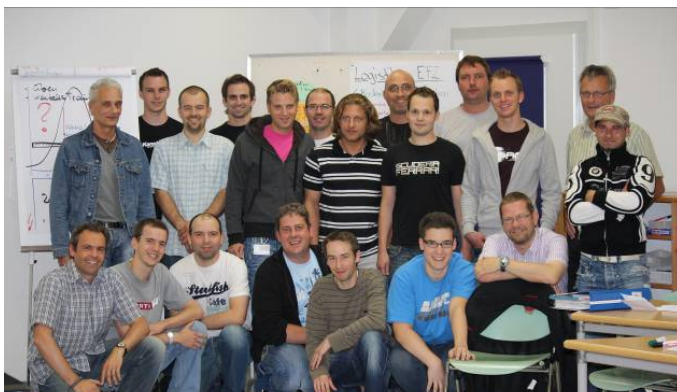
17 frischgebackene Praxisbildner am Ende ihrer internen Lehrmeistertausbildung im Juni 2009